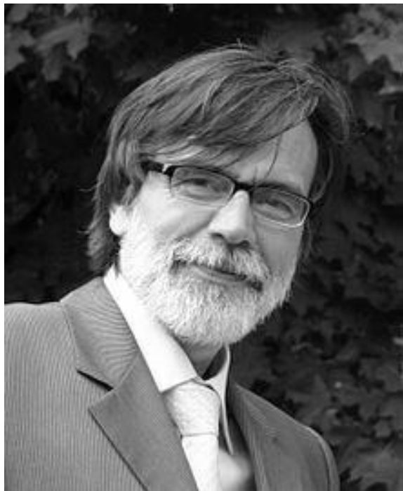
В.М.Букатов - российский педагог- психолог, методист, театральный педагог, автор драмогерменевтики.