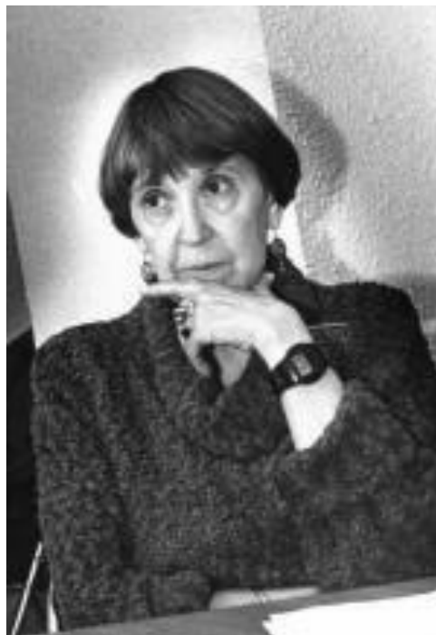
А.П.Ершова – педагог, режиссер Московского драматического театра.